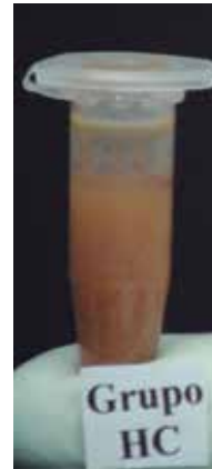
Figura 2a. Grupo HC : mezcla de hipoclorito de sodio 5.25% y clorhexidina 2%.