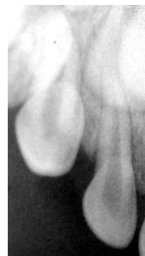
Figura 2 Canino superior primario geminado