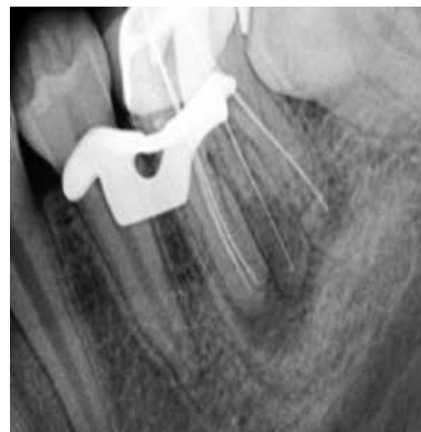
Figura 3. Radiografía de Longitud de los conductos radiculares.