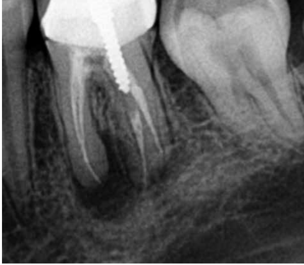
Figura 1. Radiografía Inicial.

diagnostica la presencia de Radix Entomolaris. (Figura 2). En la raíz disto lingual se observa la presencia de un endoposte metálico tipo "rosca". El diagnostico fue Tratamiento Previo, el diagnostico periapical fue Periodontitis Apical Aguda y el tratamiento indicado fue el Re-Tratamiento de los Conductos Radiculares.