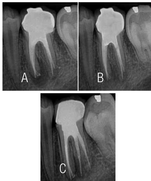
Figura 5. A. Radiografía final. B y C. Control post-operatorio. Observe el reparo óseo periapical.