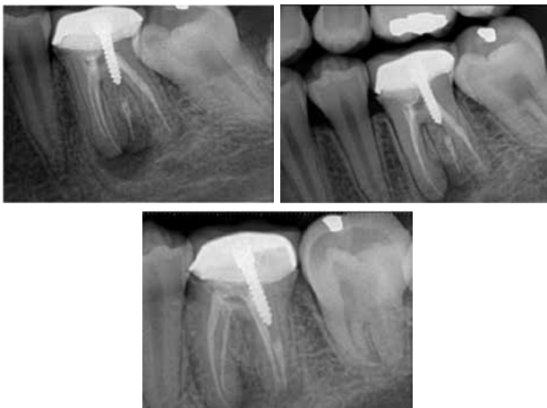
Figura 2. Radiografías Iniciales con diferentes angulaciones. Observe la presencia nítida del radix entomolaris.

A pesar de que se le insistió al paciente que sería necesario remover la corona, el mismo se negó y luego de firmar el consentimiento informado se procedió a iniciar el tratamiento. Inicialmente se realizó el aislamiento absoluto y la apertura endodóntica hasta confirmar la presencia de los